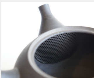
内側にはセラメッシュ(陶製の茶こし)